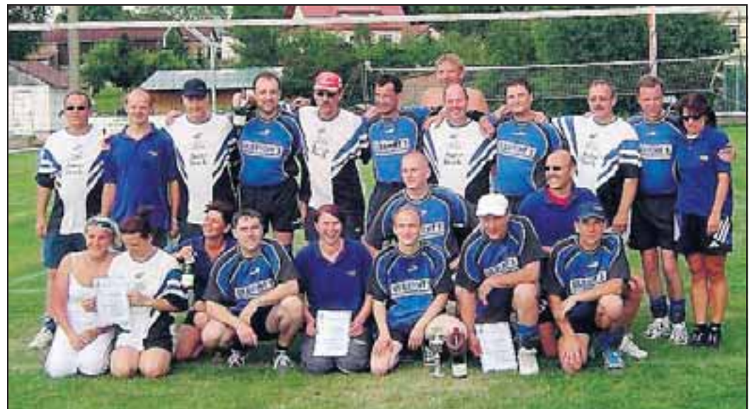
FREUNDSCHAFT: Seit einigen Jahren verbindet die Niederwillinger Volleyballer eine Sportfreundschaft mit den Sachsen vom SC Erkersdorf-Ullersdorf.

VOLLEYBALL (aho). Jede Menge Spaß, Sport und gute Laune gab es beim Volleyballturnier des Blau-Weiß Niederwillingen. Insgesamt zwölf Mannschaften, davon sechs Jugendmannschaften traten auf dem Sportplatz in Niederwillingen bei herrlichem Sonnenschein gegeneinander an. Gespielt wurde zuerst im K.O.-System, anschließend spielten die jeweiligen Sieger gegeneinander. Ganz oben auf dem Siegereppchen standen die sächsischen Gäste vom SC Erkersdorf-Ullersdorf, die den Arnstädter Raben überlegen waren. Die Jenaer Frösche setzten sich im kleinen Finale gegen die erste Niederwillinger Mannschaft durch. Mit den Gästen aus Sachsen besteht bereits eine echte Sport-Freundschaft. Seit nun-